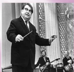
СОЛОВЬЕВ-СЕДОЙ ВАСИЛИЙ ПАВЛОВИЧ КОМПОЗИТОР, НАРОДНЫЙ АРТИСТ СССР