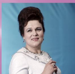
ЗЫКИНА ЛЮДМИЛА ГЕОРГИЕВНА НАРОДНАЯ АРТИСТКА СССР